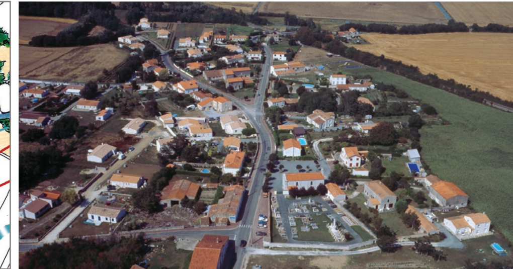
Vue aérienne de Yves