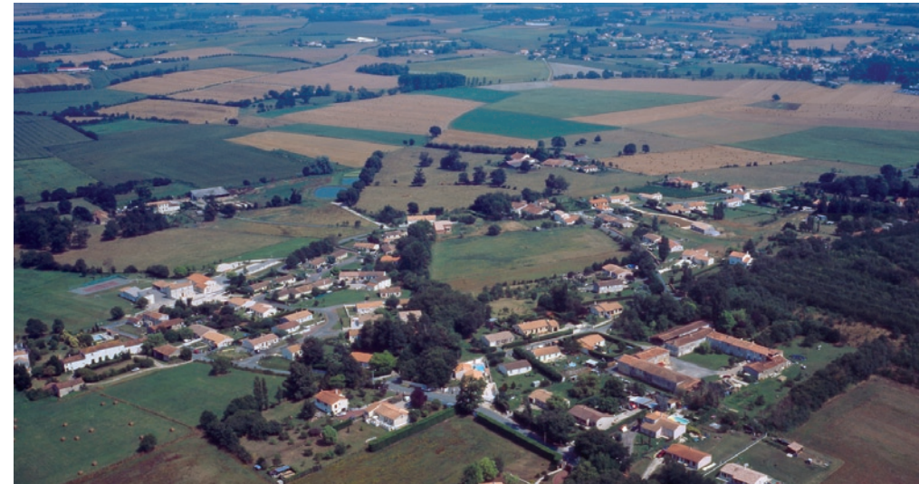
Vue aérienne de Moragne

Conscientes des enjeux qui pèsent sur les extensions urbaines et de la nécessité de mettre en place un suivi qualitatif des projets, dès la phase de planification (élaboration/révision des Plans Locaux d'Urbanisme) et jusqu'à la phase opérationnelle, les communes s'engagent à respecter les trois principes suivants :