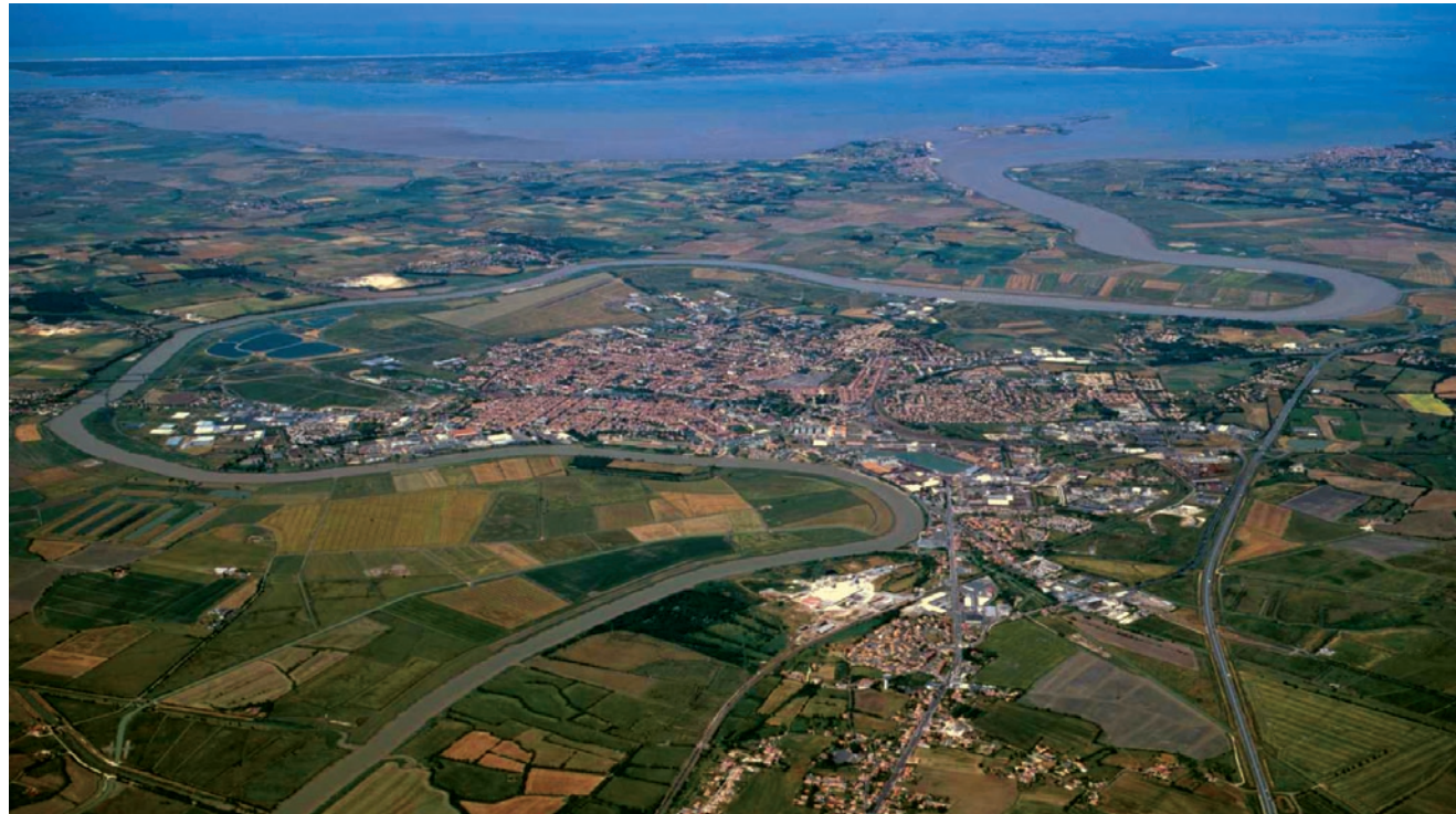
Vue aérienne de Rochefort

Face à ce constat, la CAPR a mis en place une action de sensibilisation des élus à la maîtrise et à la qualité des extensions urbaines afin de garantir la qualité de vie des habitants actuels et futurs.