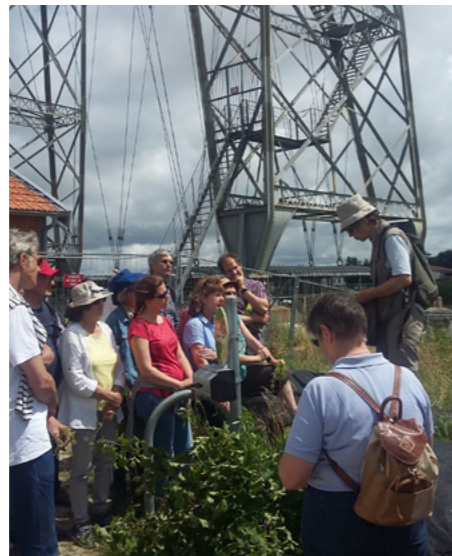
Rendez-Vous Grand Site pour les professionnels du tourisme, juin 2016