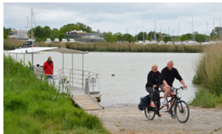
Le Rohan, navette fluviale le long de la Véloodyssée