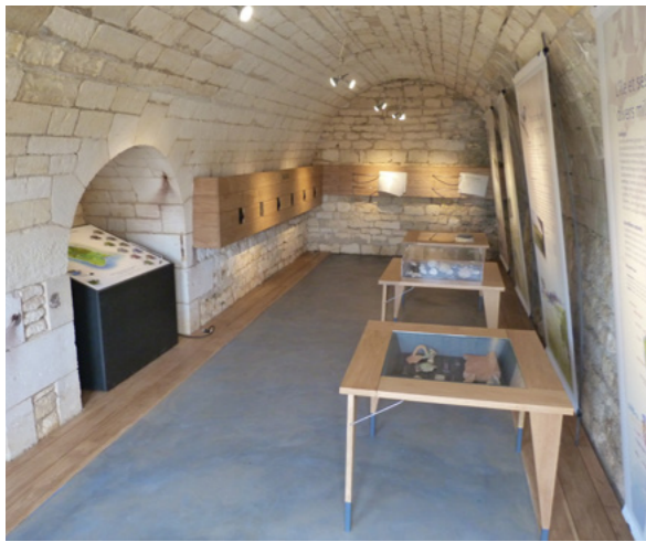
Le Fort de l'Île Madame, propriété du Conservatoire du Littoral. Création d'une exposition dans les casemates et projet d'ouverture de la terrasse du Grand Casernement

de préservation et de sensibilisation du public.