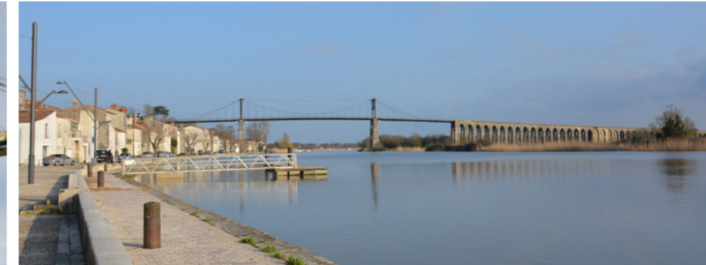
Les quais de Tonnay-Charente