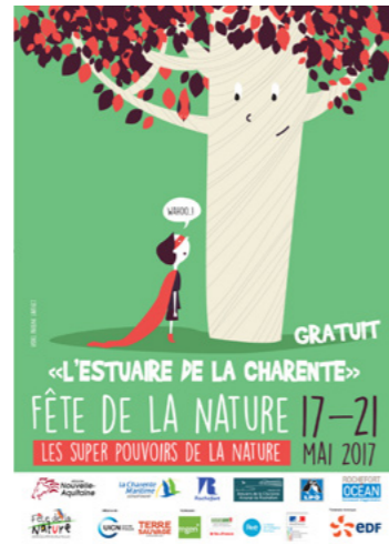
Affiche de « La Fête de la Nature »

L'Estuaire et l'Arsenal se découvrent aussi avec des itinéraires cyclables, tels que la Véloodyssée et la future Charente à vélo, ainsi qu'à bord de bacs ou de navettes fluviales au départ des pontons, modernisés et accessibles, progressivement installés au Pont Transbordeur, à Tonny-Charente et à la Corderie Royale.