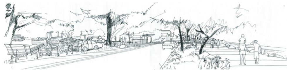
Esquisse de l'étude de la Pointe de la Fumée

à améliorer l'accueil des visiteurs et la qualité des espaces en limitant l'impact des véhicules. Ainsi, une étude en cours sur la Pointe de la Fumée définit le programme des travaux de mise en valeur.