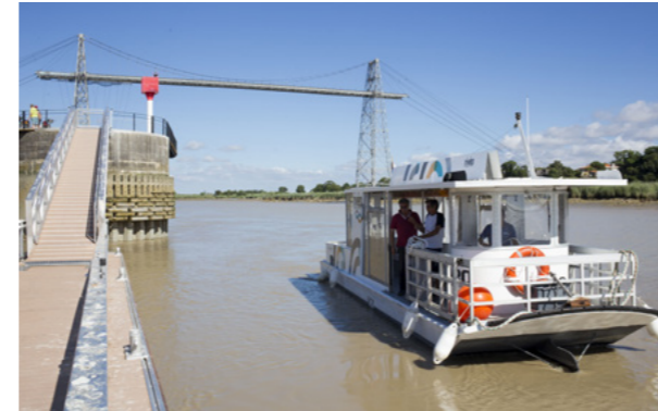
La navette fluviale L'Arnodin et le Sentier des Guetteurs - site du Pont Transbordeur

maintenir et de développer la fréquentation touristique. Quant aux quais de Tonnay-Charente, ils sont au cœur d'un projet de dynamisation du centre historique.